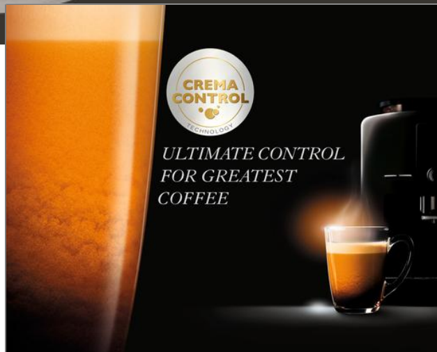
ESSENTIAL EA816 MACHINE EXPRESSO ENTIÈREMENT AUTOMATIQUE ESSENTIAL ÉCRAN SET AUTO CAPP EA816B70